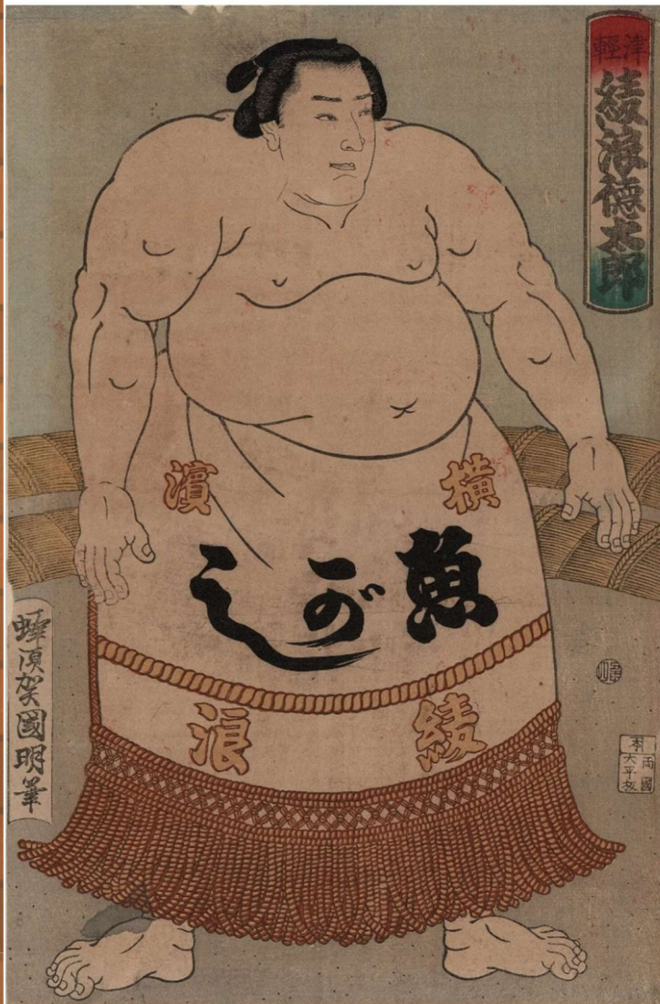
蜂須賀 国明「津軽綾波徳太郎」青森県立図書館蔵

キーワードは 「にもすかいぶも んすうがくかんす うてんすうもじぎ やすらりー」 にある