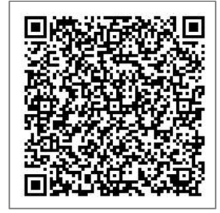
青森県電子申請・届出システム